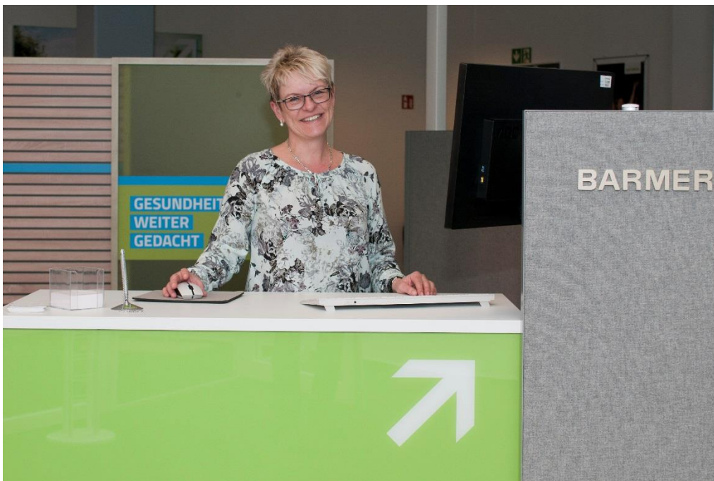
Kleinere Anliegen können hier im Eingangsbereich sofort erledigt werden.