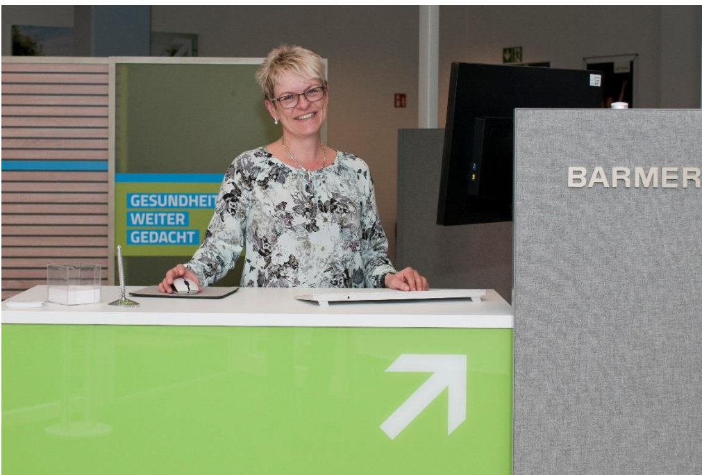
Kleinere Anliegen können hier im Eingangsbereich sofort erledigt werden.