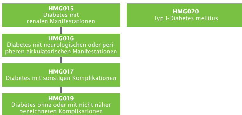
Abbildung 1: Hierarchie 3 Diabetes mellitus

Neben der Unterscheidung eines Zuschlags nach Schweregrad des Diabetes mellitus wird dem Typ I-Diabetiker zusätzlich der Zuschlag der HMG020 angerechnet. Aufgrund der Hierarchisierung kann jeder Diabetiker gemäß dieser Definition nur genau einen Zuschlag aus HMG015 bis HMG019 erhalten. Daher lässt sich die Gesamtzahl durch die Addition der Anzahl der Versicherten mit diesen HMG ermitteln. Die Typ II-Diabetiker lassen sich somit errechnen, indem die Anzahl der Patienten mit der HMG020 von der Summe der Patienten mit den HMG015 bis HMG019 subtrahiert wird. Die Morbiditätsgruppen werden vom BVA (2011) auf Basis ambulanter wie stationärer Diagnosen (ICD-Kode) sowie von Arzneimittelverordnungen (ATC-Kode) definiert. Die HMG selbst werden gebildet aus einer oder mehrerer Dx-Gruppen.