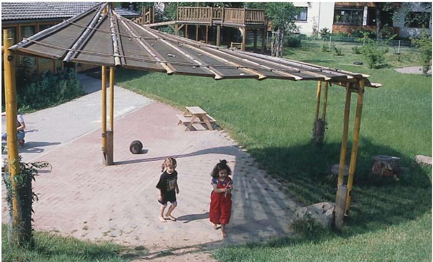
Ein sonnengeschützter Außenspielbereich, Quelle: Landesunfallkasse Nordrhein-Westfalen