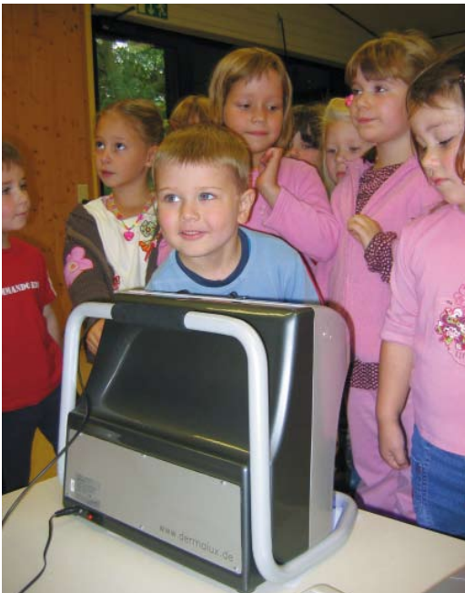
Eincremekontrolle mit Fluoreszenztest

Grundschul Kinder können darüber hinaus über Beispiele aus der Tierwelt oder fremden Kulturen an das Thema herangeführt werden. Für den Vorschul- und Primärschulbereich geeignet sind auch Projekte wie sie z.B. in den „Lehrerbriefen“ des Bundesverbands der Unfallkassen vorgestellt werden.